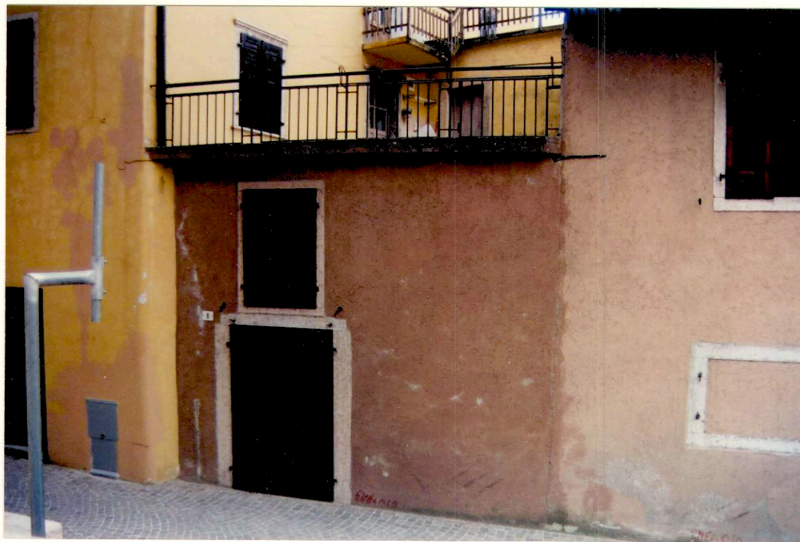
Documentazione fotografica - Immagine 2 (Rif.archivio:negativo ___ fotogramma ___)