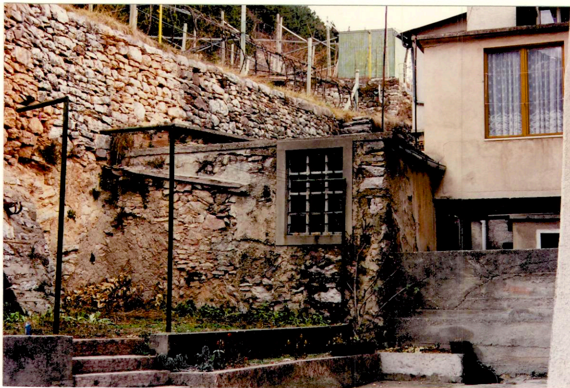
Documentazione fotografica - Immagine 2 (Rif.archivio:negativo__ fotogramma__)