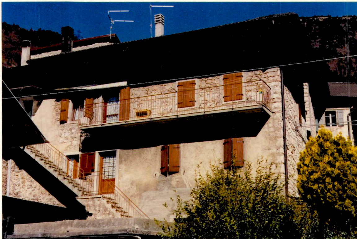
Documentazione fotografica - Immagine 2 (Rif.archivio:negativo___ fotogramma___)