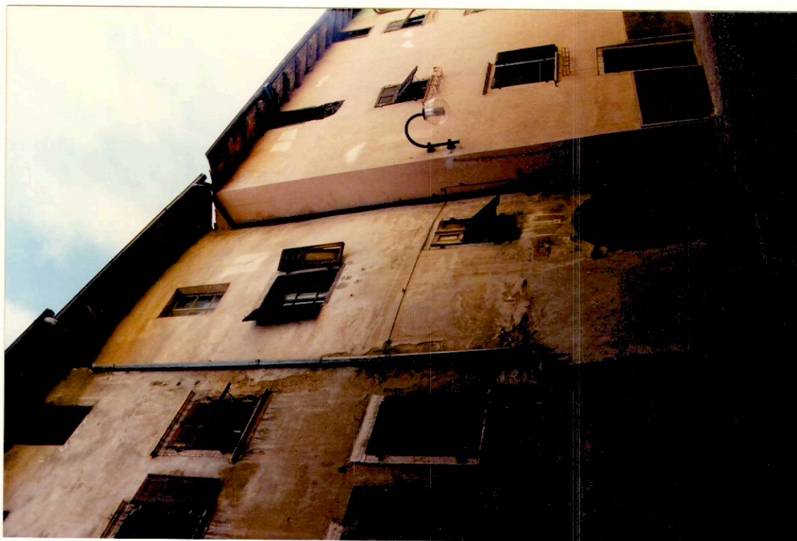
Documentazione fotografica - Immagine 2 (Rif.archivio:negativo ___ fotogramma ___)