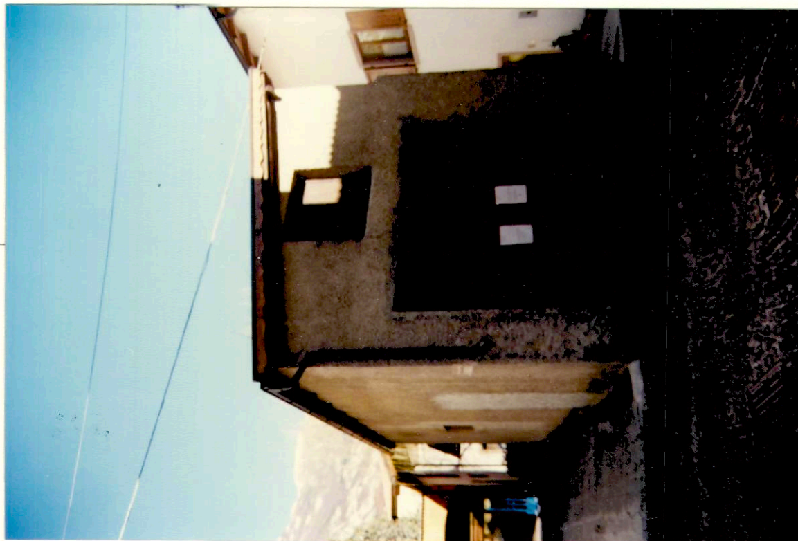
Documentazione fotografica - Immagine 2 (Rif.archivio:negativo__fotogramma__)