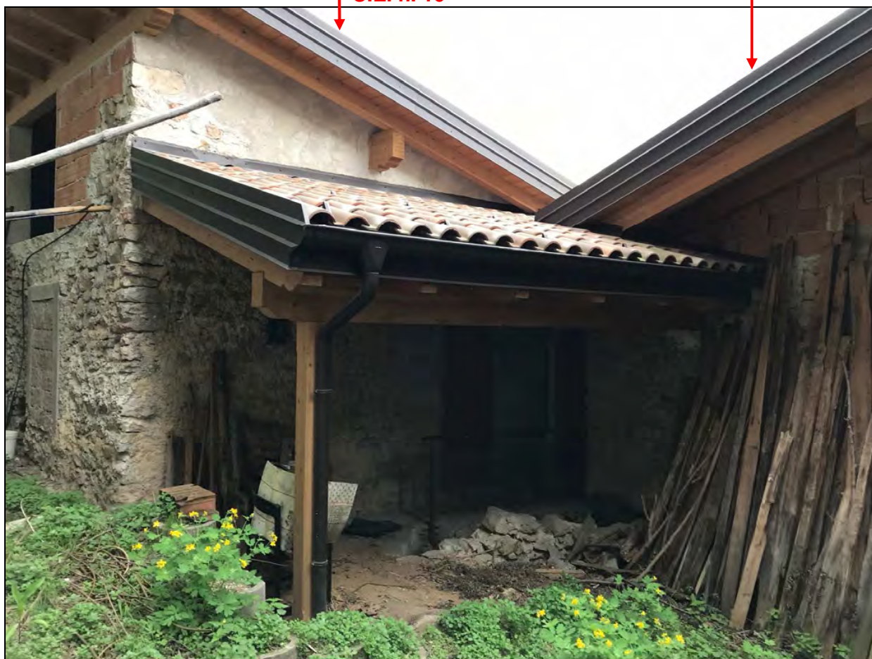
Angolo (interno) nord-ovest