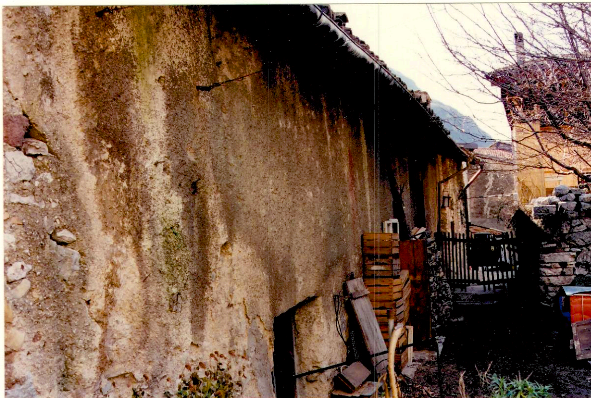
Documentazione fotografica - Immagine 2 (Rif.archivio:negativo__ fotogramma__)