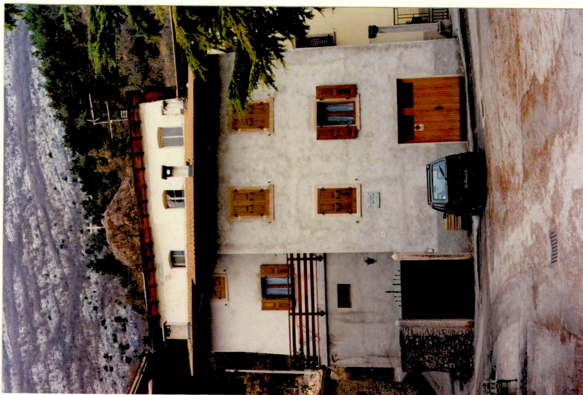
Documentazione fotografica - Immagine 2 (Rif.archivio:negativo ___ fotogramma ___)